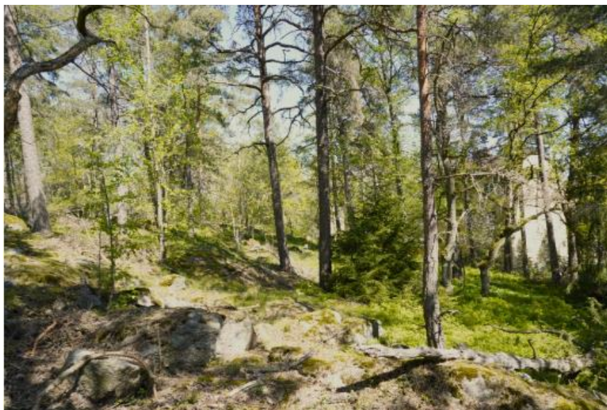
Figur 2. Majroskogen domineras av flerskiktad skog med lång trädkontinuitet.

I området finns fyra registrerade nyckelbiotoper – dessa områden utgör reservatets värdekärnor tillsammans med det mycket gamla tallskogsparti och en äldre hållmarkstallskog som ligger i reservatets norra del.